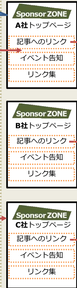
スポンサートップページ

編集部が品質を担保しながら、賛同企業各社が主体となり、技術情報、製品・サービス情報を発信する場所