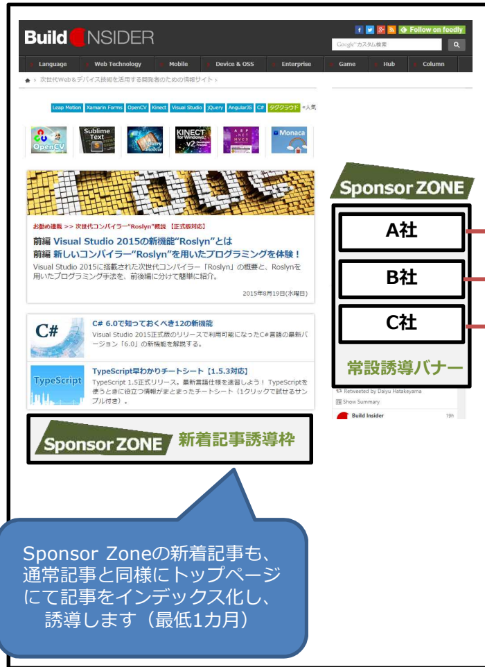
Build Insider本サイト（トップページ）

Sponsor Zoneの新着記事も、通常記事と同様にトップページにて記事をインデックス化し、誘導します（最低1カ月）